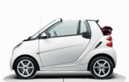
Basismodell smart fortwo pulse cabrio mit bodypanels und tridion-Sicherheitszelle in Kristallweiß und rotem Verdeck

Shelley entwirft Mode, die ihre Handschrift trägt: unkonventionell und voller Gegensätze. Das Spiel mit Kontrasten und Akzenten begeistert sie jeden Tag neu. Ihre Wahl ist auf ein smart fortwo pulse cabrio in Weiß mit rotem Verdeck gefallen. Den Innenraum hat sie mit smart BRABUS tailor made ihrer Modephilosophie angepasst. Denn mit einer Lederausstattung in Rot, weißen Ziernähten und weiß lackierten Akzent- und Kontrasteilen greift Shelley die Farben des Exterieurs auch innen auf und macht so ihr Auto zu einem Einzelstück mit besonderer Note.