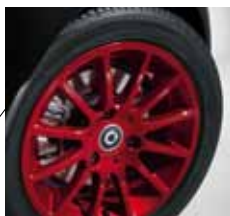
serienmäßiges passion Leichtmetallrad, lackiert in Rot Metallic