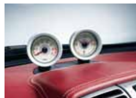
Zusatzinstrumente mit Akzentringen, lackiert in Weiß