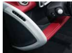
Akzent Boomerang, lackiert in Weiß, Kniepad in Leder Rot mit Ziernähten in Weiß