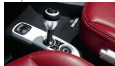
Akzent Mittelkonsole, lackiert in Weiß, und BRABUS Schaltknäuf