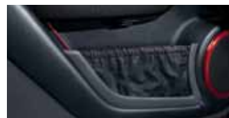
Türverkleidung und Türtaschen in Leder Schwarz mit Ziernähten in Rot