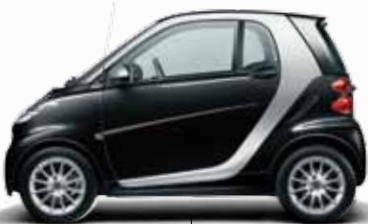
Basismodell smart fortwo passion coupé mit bodypanels in Tiefschwarz