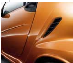
bodypanels und tridion-Sicherheitszelle in Kupfer Metallic