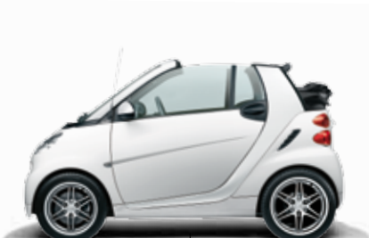
Basismodell smart fortwo BRABUS cabrio