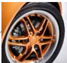
serienmäßiges BRABUS Leichtmetallrad, Felgenstern lackiert in Kupfer Metallic