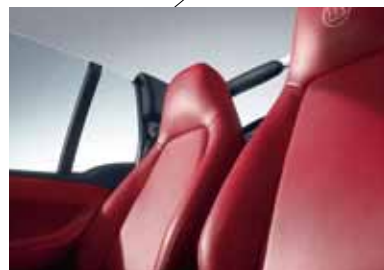
Ledersitze in Rot mit Ziernähten in Weiß